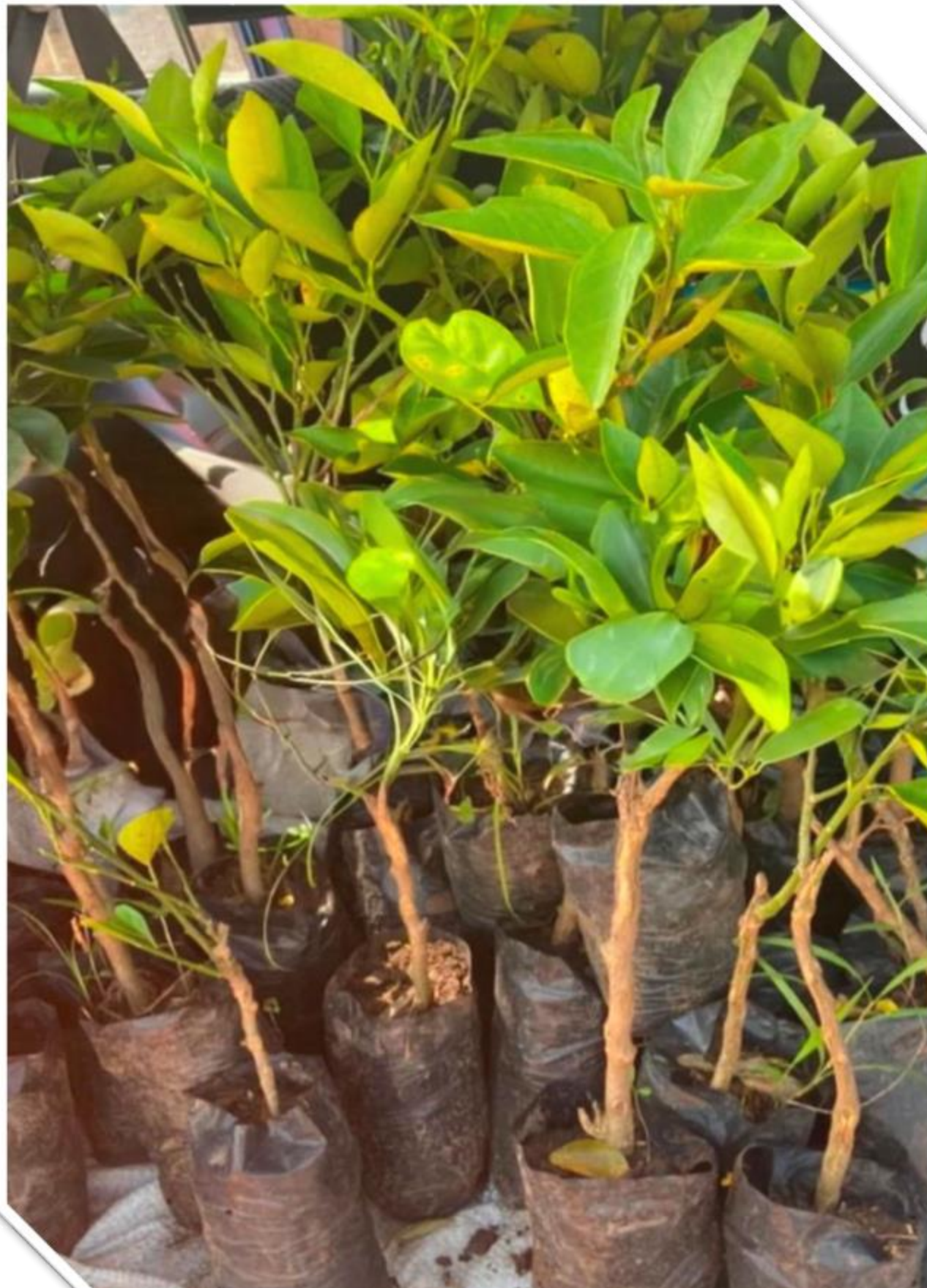
Activite de reboisement