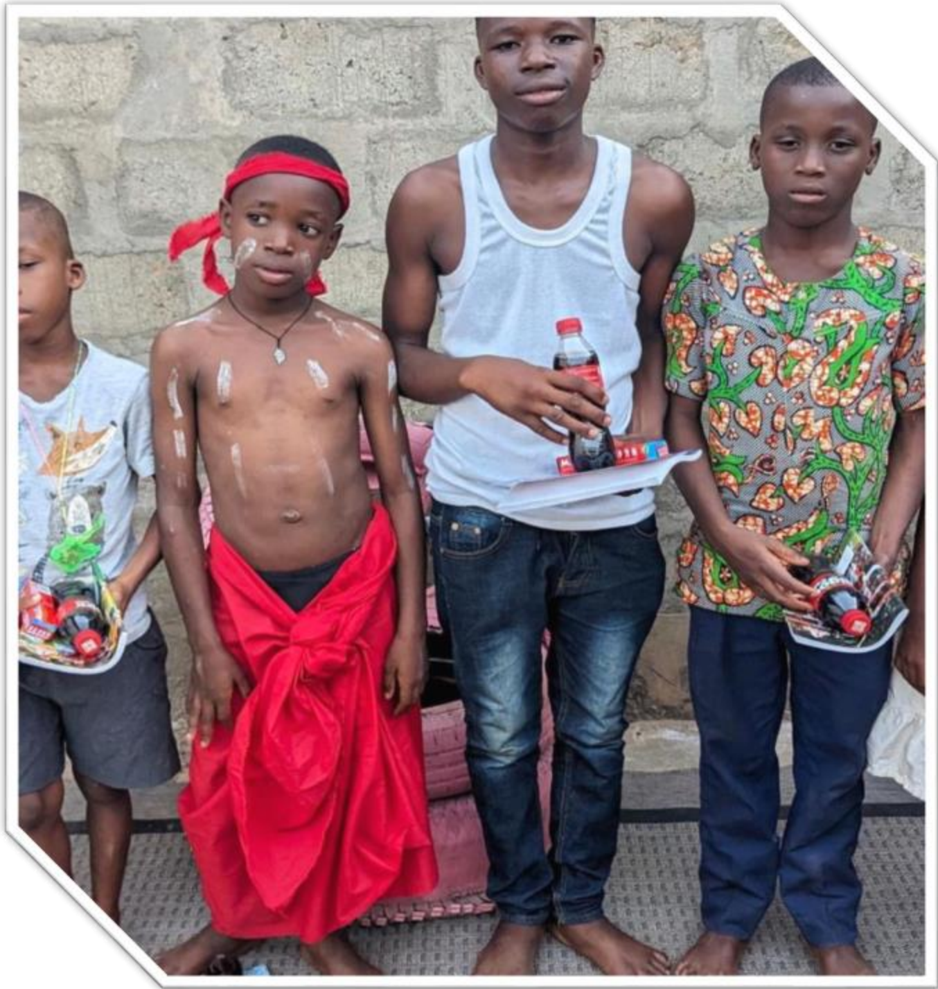
Décembre 2023 (Noel avec les enfants)