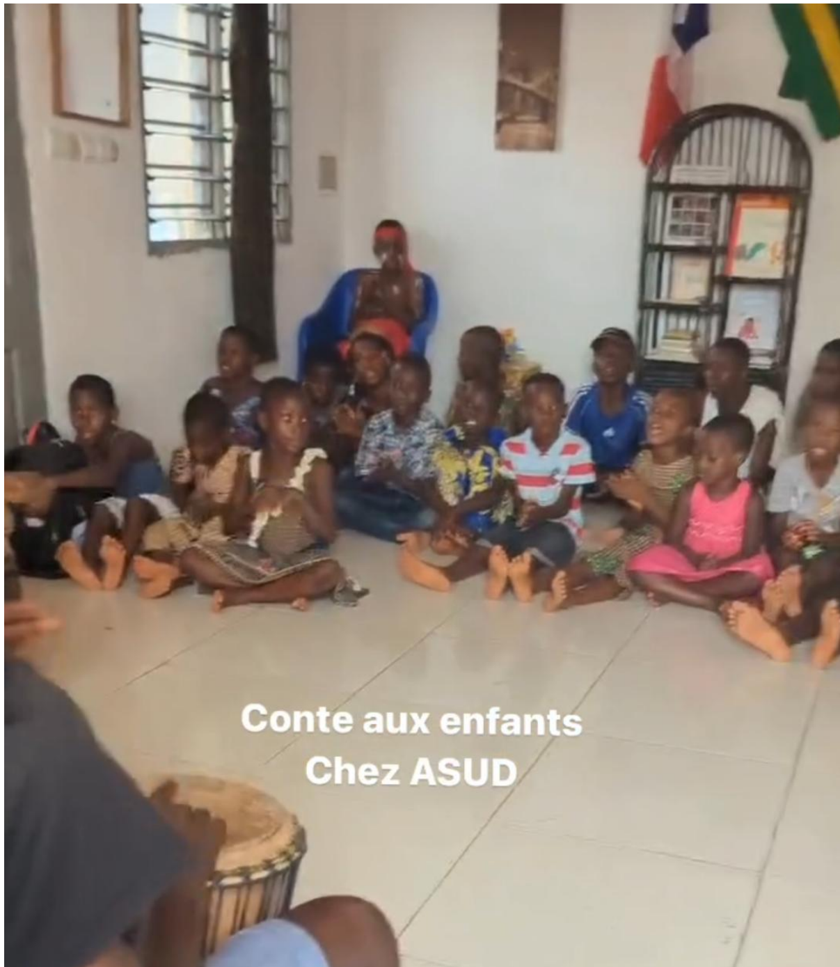
Conte aux enfants Chez ASUD