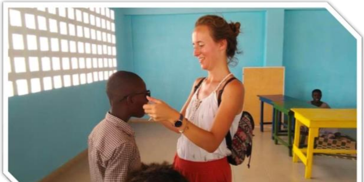
Activités avec le Centre ATEIPEIDI : Initiatives de soutien et d'engagement avec les enfants en situation de handicap.