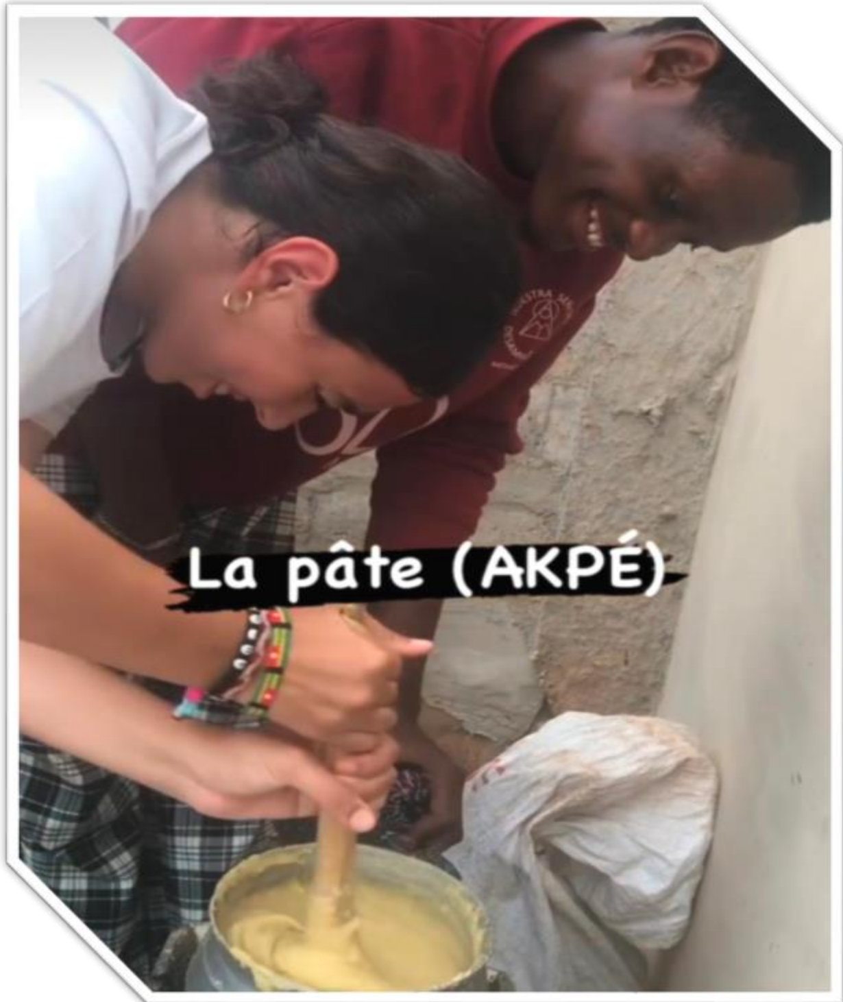
Initiation a la cuisine locale