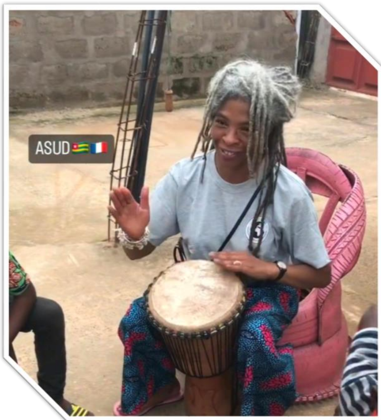
Une de nos benevoles a l'animation au djembé avec les enfants