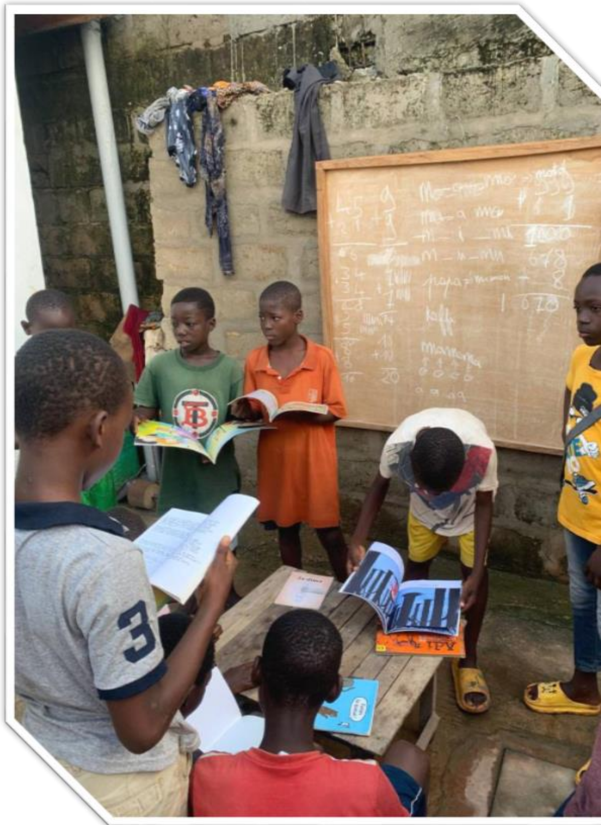
Village de Yidavé : Programmes similaires avec des ressources éducatives supplémentaires et un soutien pédagogique continu pour assurer l'accès à une éducation de qualité.