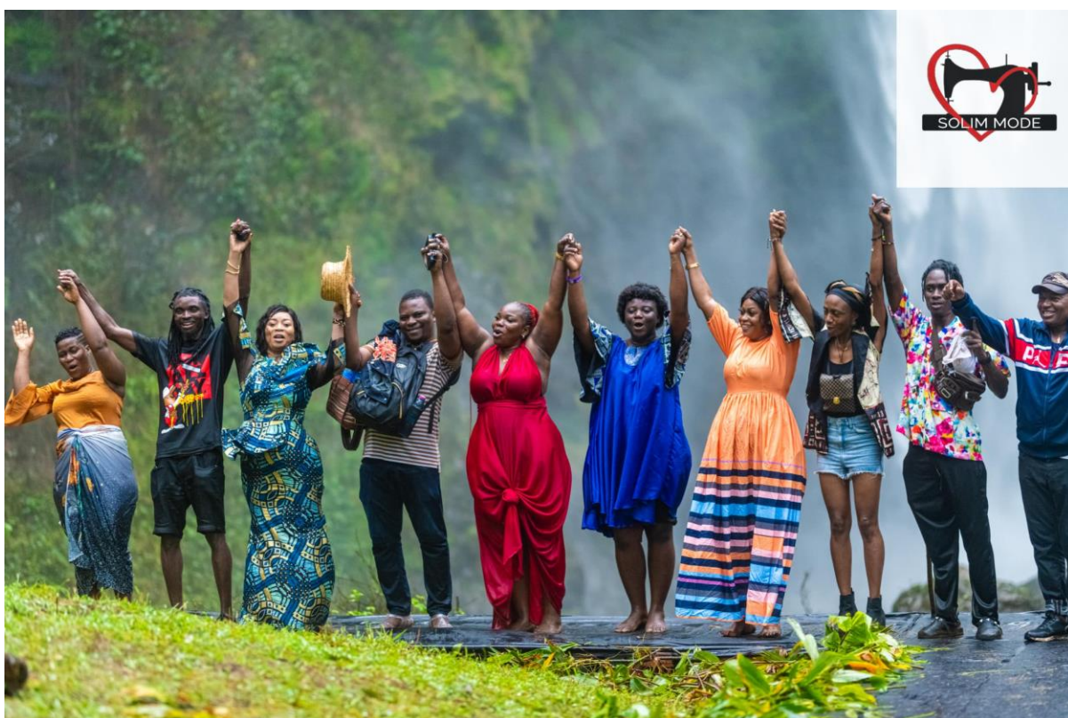
Participation a l'événement de défilé de mode de notre partenaire solim dans le cadre d'une action humanitaire d'un le but est de protéger l'environnement