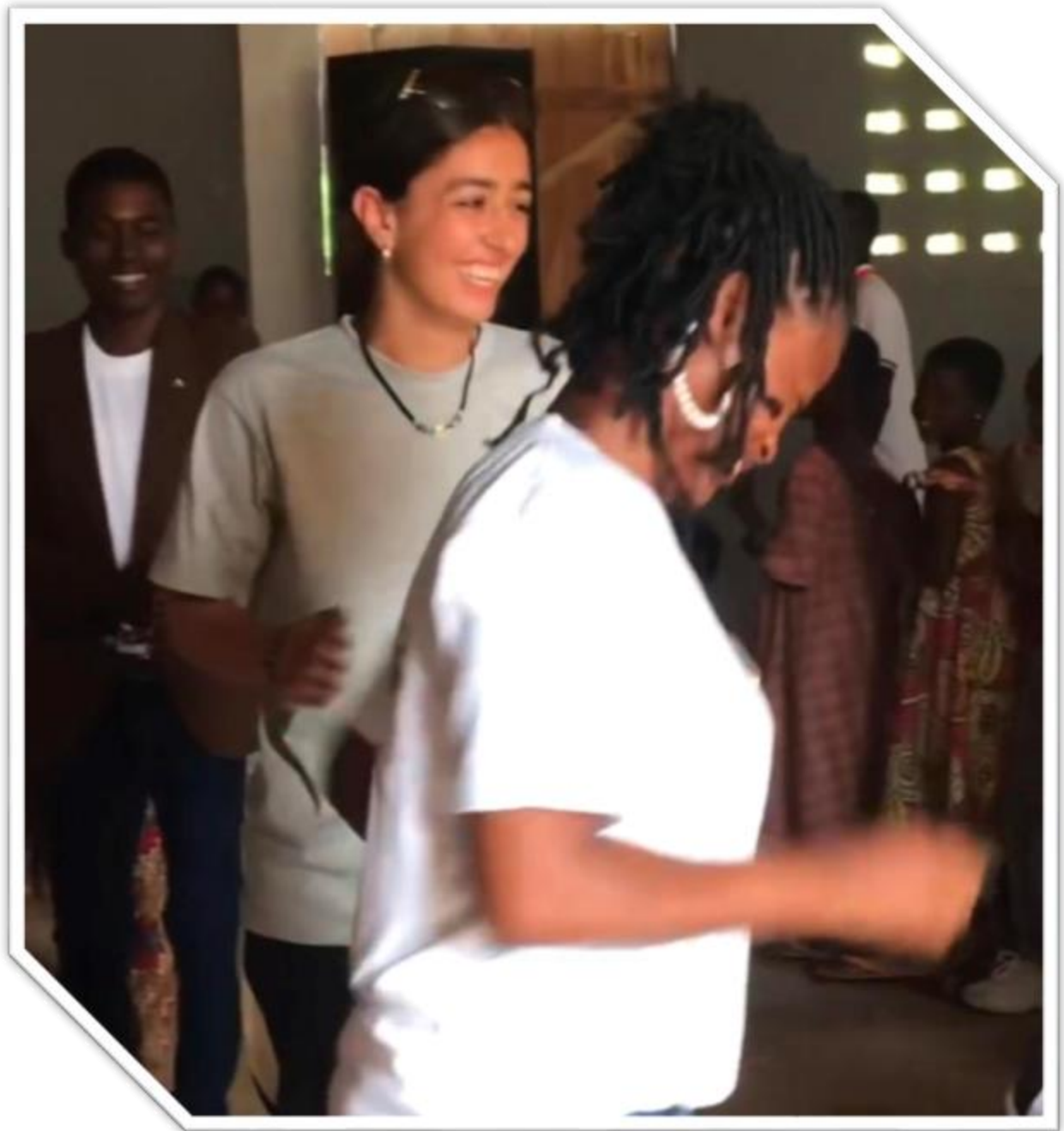
Partie de Danse a un anniversaire