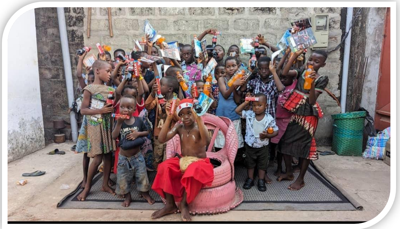
Célébration de Noël: Organisation de fêtes de Noël pour les enfants des villages, avec des cadeaux, des jeux et des activités festives, créant des moments de joie et de partage.