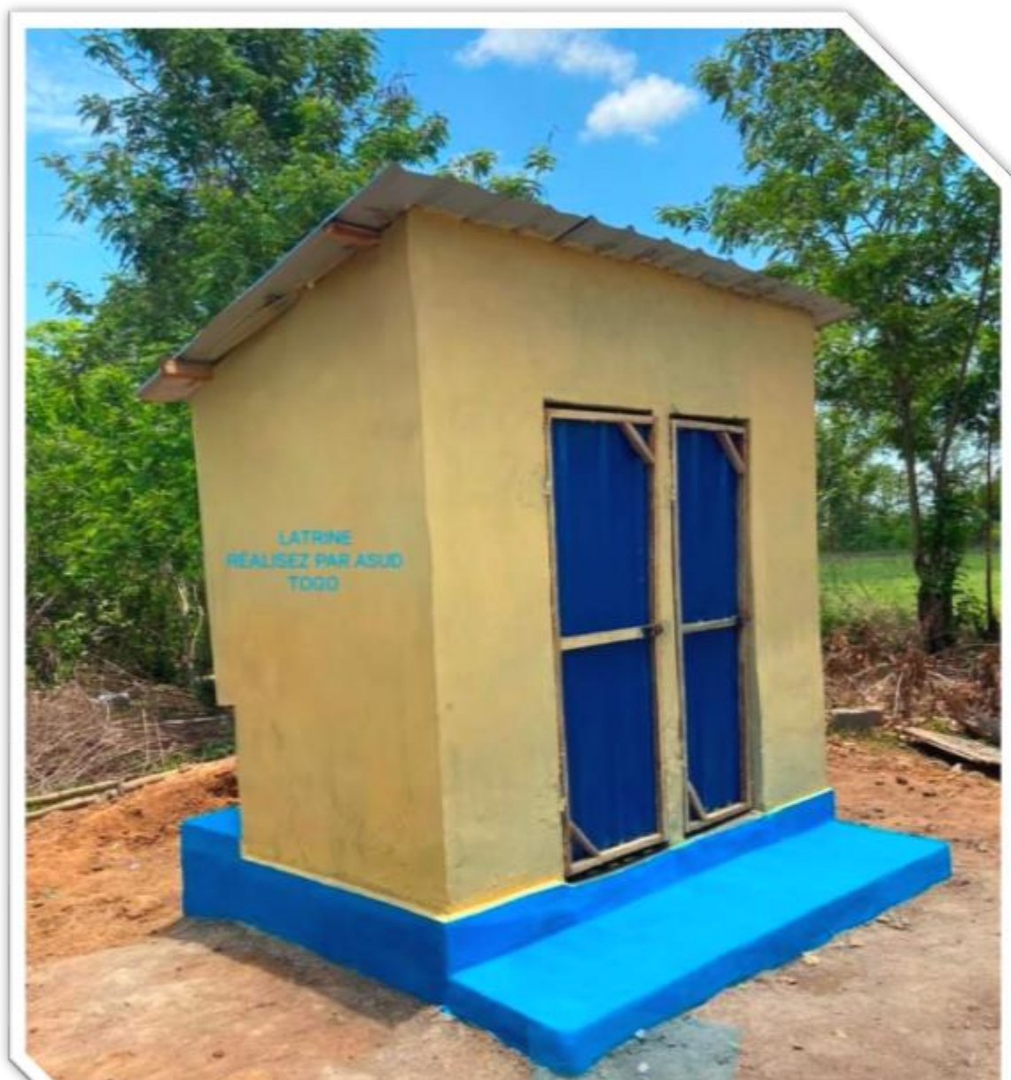
Construction de Latrines Publiques à Glé Condjé : Mise en place d'infrastructures sanitaires pour améliorer les conditions d'hygiène et de santé publique.