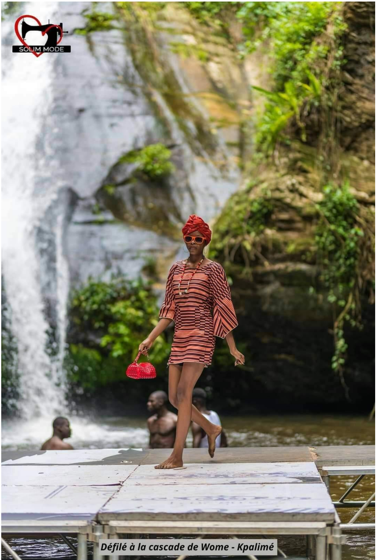
Défilé à la cascade de Wome - Kpalimé